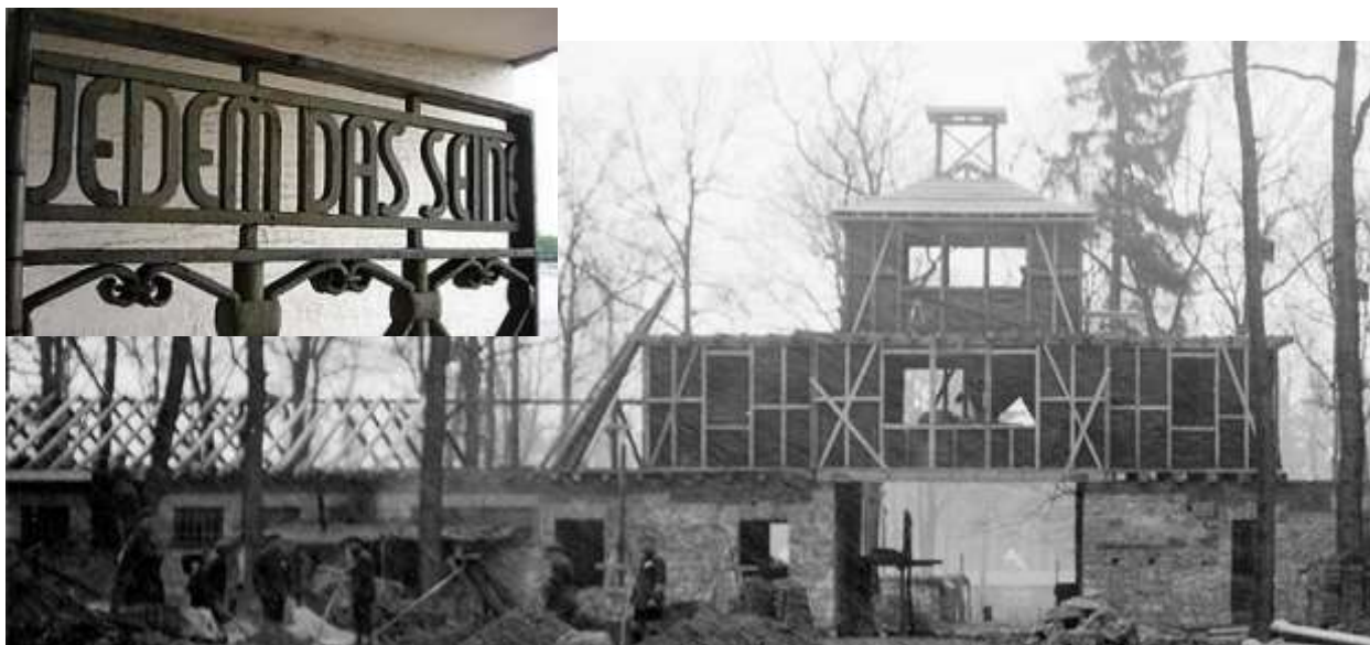
Июль, 1937 г. Строительство центральных ворот Бухенвальда.

Концентрационный лагерь СС Бухенвальд был создан в 1937 году. Первоначально он назывался Эттерсберг и был предназначен для изоляции противников правящего режима. На главных воротах Бухенвальда было изречение Цицерона «Jedem das Seine» - «Каждому - своё».