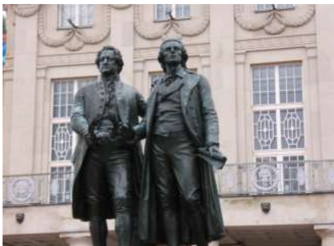
статуя Гете и Шиллера

Бухенвальд (Buchenwald), немецко-фашистский концентрационный лагерь. Создан в 1937 в окрестностях Веймара. Первоначально назывался Эттерсберг.