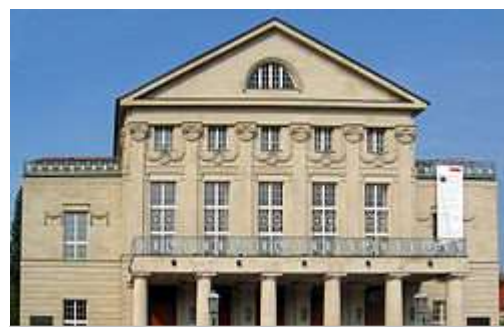
Немецкий национальный театр в Веймаре

И, будто в насмешку над теньми великих предков, на склонах знаменитой горы Эттерсберг фашисты устроили гигантский концлагерь – концлагерь Бухенвальд, пожалуй, самый известный из нацистских концлагерей.