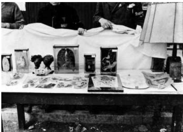
Изделия из человеческой кожи

А ещё страшнее, что из человеческой кожи с красивыми татуировками изготавливали предметы домашнего обихода, например, дамские сумочки, из человеческих костей делали настольные лампы с абажуром.