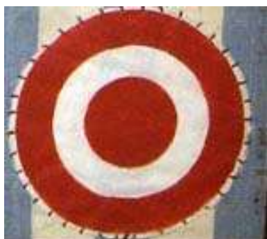
пытался совершить побег