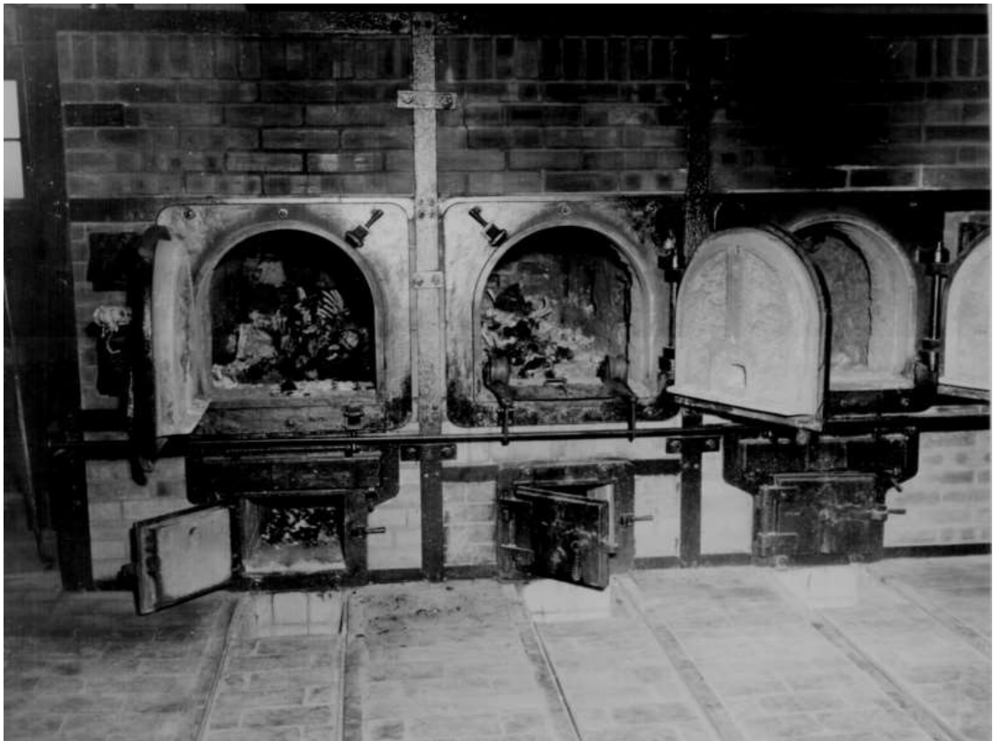
Останки узников в крематории концлагеря Бухенвальд неподалеку от Веймара, обнаруженные солдатами 3-й американской армии.