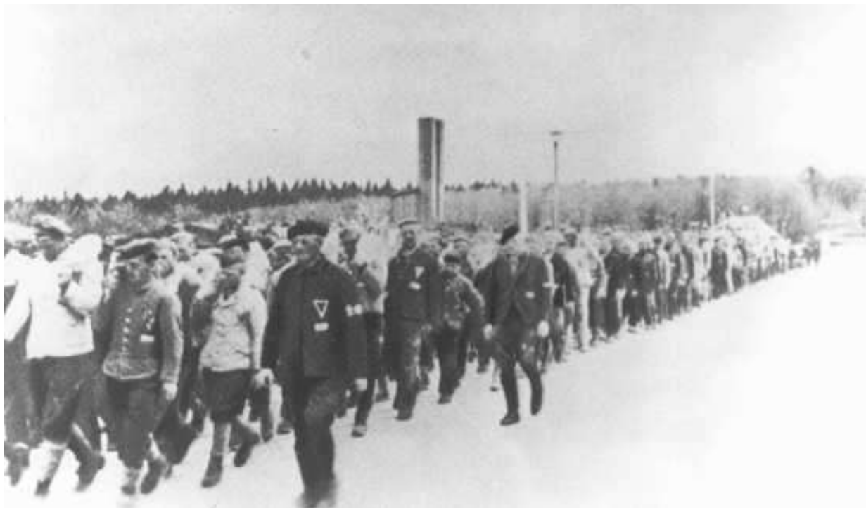
Заклученные концлагеря Бухенвальд несут камни, возвращаясь с работы в каменоломне, расположенной более чем в шести милях от лагеря. Германия, дата неизвестна.

С раннего утра и до поздней ночи, по 12—14 часов в сутки, работали узники и в других командах — по строительству лагеря, военного завода и железной дороги.