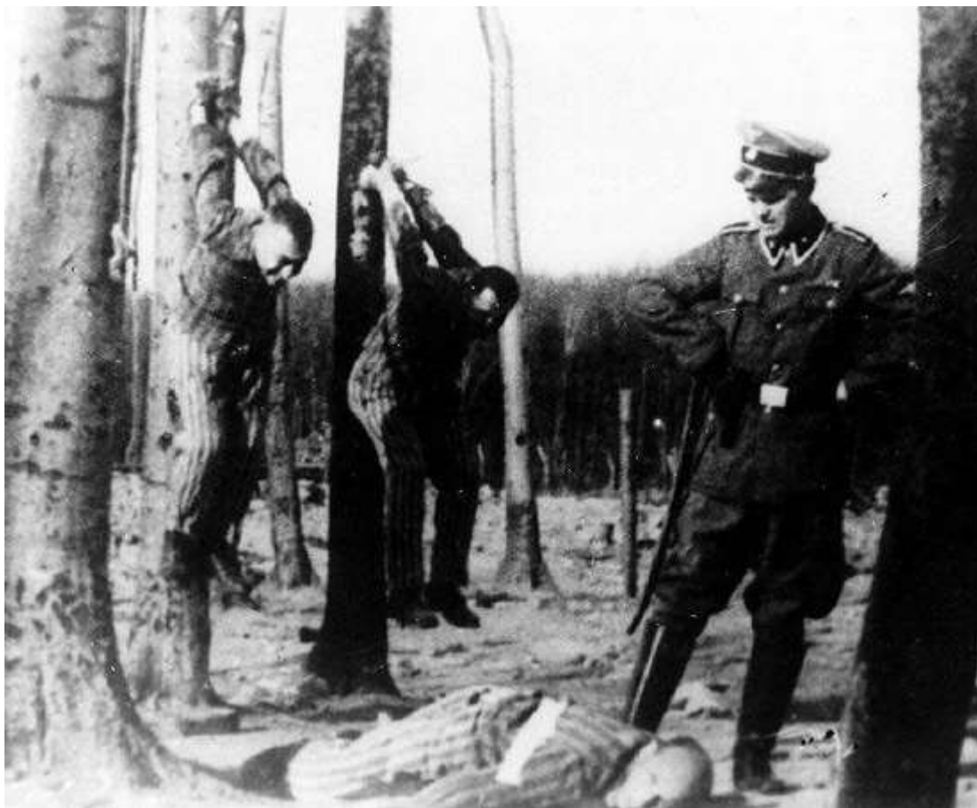
Курт Франц в Бухенвальде http://samlib.ru/img/s/starcewa_a_k/treb002/

Одним из самых жестоких наказаний было подвешивание к столбу. Всей своей тяжестью узник, подвергавшийся такому наказанию, висел на вывихнутых назад плечевых суставах. Это вызывало тяжёлые вывихи и растяжение сухожилий. Смотря по настроению, эсэсовский палач ещё и избивал свою жертву.