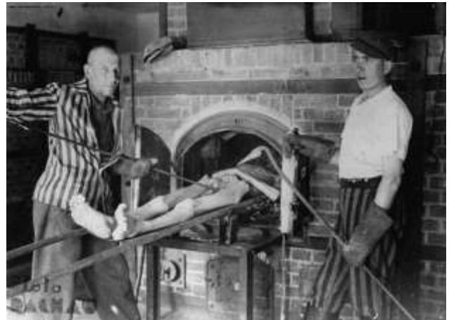
Бухенвальдский крематорий. Здесь сожжены многие тысячи невинных людей