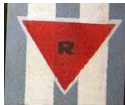
политический из СССР

Политзаключенным не разрешалось носить свою обувь. Фашисты изобрели «универсальную обувь» — деревянные колодки, от которых на ногах образовывались мозоли и долго не заживающие раны.