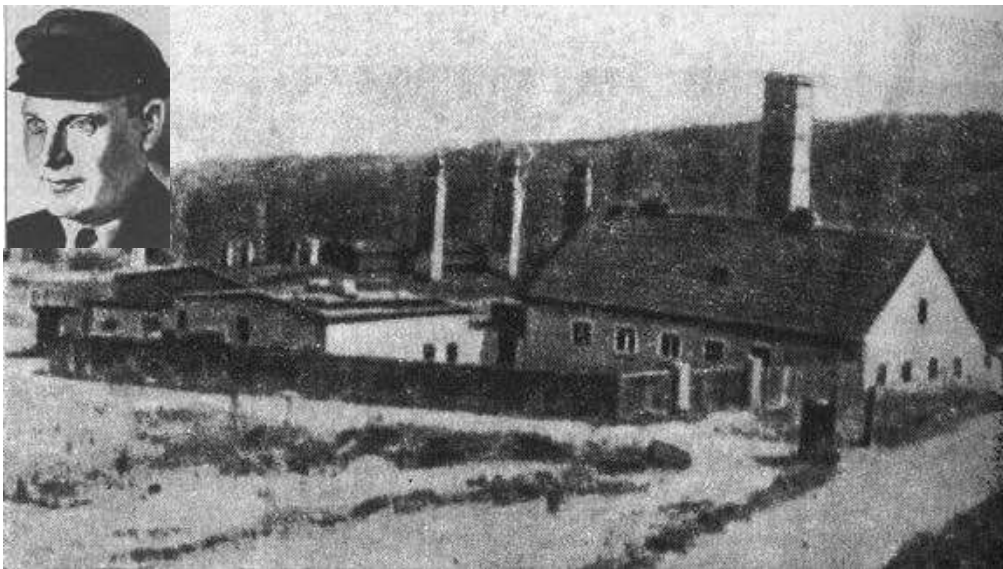
Крематорий Бухенвальда, в которм 18.08.1944 г. был умерщвлен, вождь германского рабочего класса Эрнст Тельман

Каждого упавшего в подземелье палач большим деревянным молотком с размаху бил по голове. Двое других подтягивали оглушенного к каменной стене, где на высоте выше человеческого роста были вбиты 48 железных крюков. Палачи вешали на них свои жертвы за нижнюю челюсть. Человек умирал мучительной смертью...