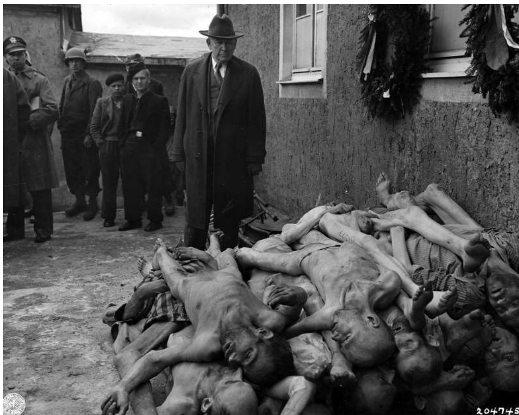
Жители немецкого города Веймар в концлагере Бухенвальд у тел погибших узников. Американцы привели в лагерь жителей Веймара, находившегося неподалеку от Бухенвальда, большинство из которых заявляло, что ничего не знают об этом лагере. Время съемки: 25.04.1945